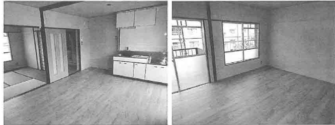
ファミリーに最適な3DK